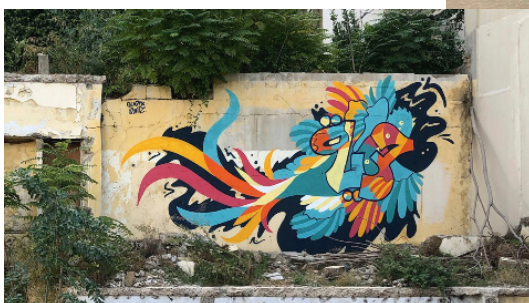
Photographies de murs à Beyrouth

L'oiseau est créé à partir du mot « Liberté »