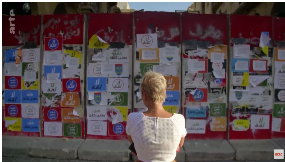
Image extraite du documentaire Liban, l'épreuve du chaos de Amal Mogaizel