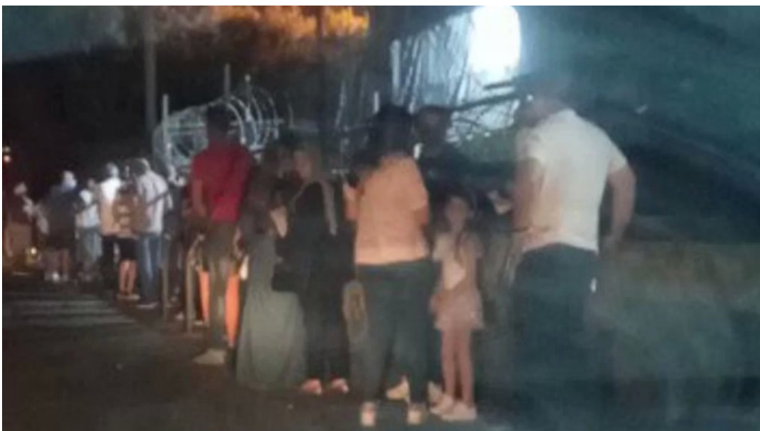
Files d'attente nocturnes devant l'administration de la Sûreté Générale à Beyrouth, en vue de renouveler son passeport - 2021