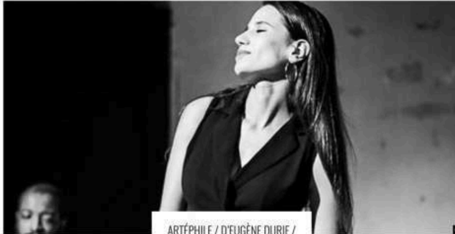
ARTÉPHILE / D'EUGÈNE DURIF / CONCEPTION MONA EL YAFI ET MATHIAS GAULT